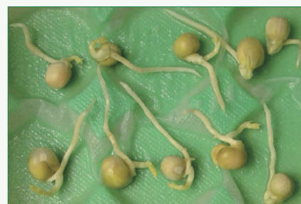
Abb. 3: Erbsenwurzeln mit Bewellung (20 min. Hitze, nach 132h Keimung).

Erbsensamen entfernt und zusätzlich in einem anderen Raum stand, kann man davon ausgehen, dass es sich bei der Bewellung um eine Fernwirkung des Gerätes handeln muss. Da unmittelbar einsichtig ist, dass die zugrunde gelegten und hier offenkundig wirksamen Affirmationen (...) eine gedankliche bzw. geistige Wirkung auf das Wachstum der Erbsenwurzeln ausüben, ist somit das Grund-Postulat der Naturwissenschaft durchbrochen, nämlich, dass Geist nicht auf Materie einwirken kann.“