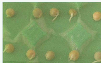
Abb. 2: Erbsenwurzeln ohne Bewellung (20 min. Hitze, nach 132h Keimung).