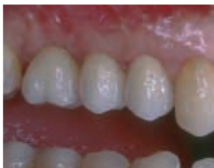
Abbildung 4: Zirkon-Kronen

Implantate werden vom Organismus in der Regel als körperfremd erkannt. Durch moderne Forschung ist es zwar gelungen Materialien zu entwickeln oder zu verwenden, die möglichst schwache Immunreaktionen nach sich ziehen, aber ganz unterdrücken kann man das nicht einmal mit Materialien wie Titan.