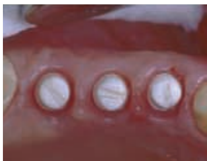
Abbildung 3: Zirkon-Implantate

Dazu wurden die Implantate in ihrer sterilen Verpackung mit den Schwingungen folgender Einträge informiert: Arnica D4, Symphytum D3, Knochencompacta D2, Harmonische Regulation LM 50. Abgesehen davon läuft alle 4 Stunden für 10 sec. im Dauerprogramm ein von der Diode mit weissem Rauschen ermitteltes Programm mit folgenden Einträgen: