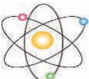
Abbildung 1: Atommmodell

Geräte, die mit solchen Dioden arbeiten, können solche Bio-Felder scannen und gegebenenfalls auch neu informieren.