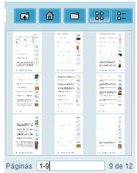
3 | Nueva función: Crear a partir de PDF ...

De este modo es posible registrar de un modo muy sencillo lo que se guardó en formato PDF.