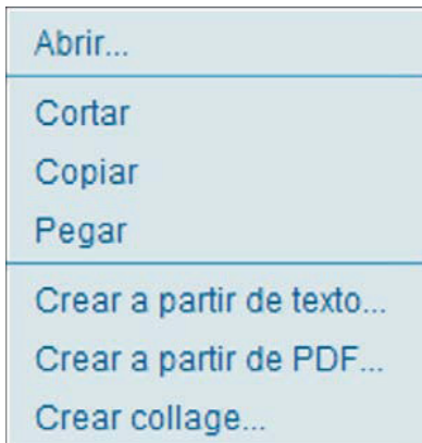
1 | Nueva función: Crear collage ...

Haciendo clic con el botón derecho del ratón en un marco cualquiera de la imagen, se abre el menú que ya conoce con dos opciones nuevas; en este caso se trata de "Crear collage...".